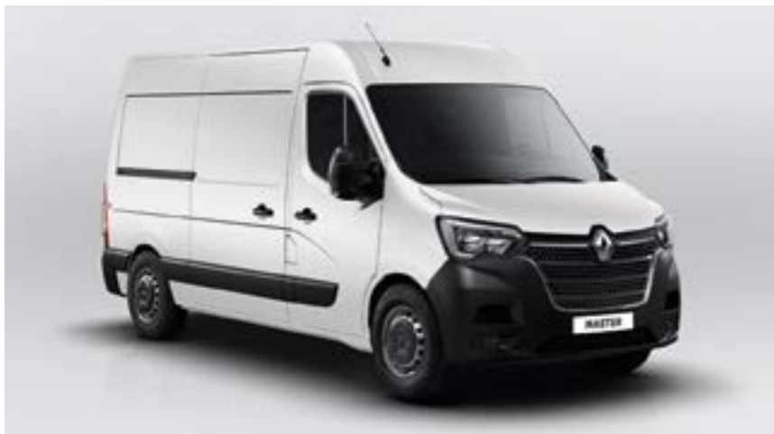
blanco glaciar (bo)*

bo: barnizado opaco *foto no contractual